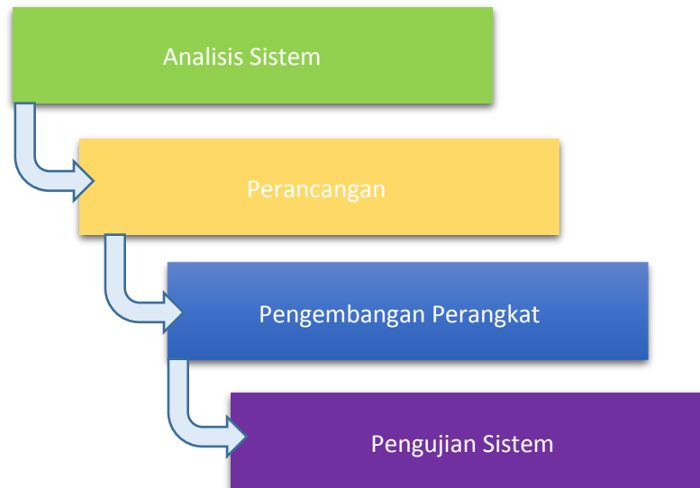
Gambar 2. Metode Pelaksanaan

Tahap-Tahap dalam rancangan sistem dapat dilihat pada gambar 1. [2]