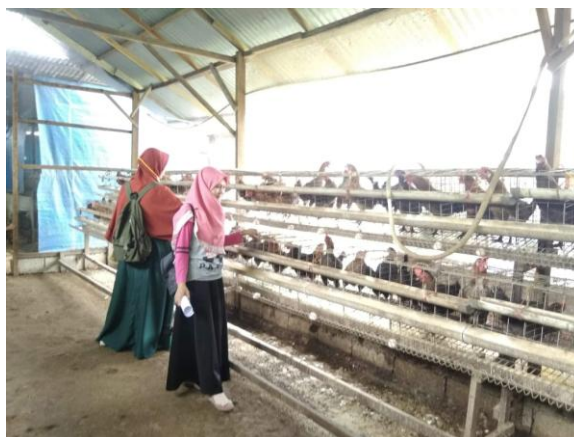
Gambar 1. Lokasi Peternakan Ayam Linda

Peternakan Ayam Linda merupakan salah satu peternakan ayam petelur yang ada di Kota Padang. Dalam bisnis peternakan ini, masalah yang sering dihadapi adalah masalah penyakit ayam, penyakit ini dapat diakibatkan oleh virus, faktor cuaca, dan faktor suhu. Cuaca yang tidak kondusif seperti hujan secara terus menerus dapat mengakibatkan ayam tersebut sakit bahkan bisa sampai mati. Dan suhu yang terlalu dingin atau terlalu panas pun juga dapat mempengaruhi kesehatan ayam. Kemudian dalam melakukan pemantauan perkembangan ayam, pemilik peternakan masih menggunakan cara yang manual yaitu dengan cara mengingat kapan ayam ini bertelur, kapan pemberian vitamin, dan berapa ayam yang mati, dan dalam memantau kondisi kandang, suhu, dan cuaca peternak masih melakukannya dengan cara menerka-nerka, belum dapat mengetahui suhu dan cuaca secara pasti. Tentu hal ini membuat pemantauan perkembangan ayam tidak efektif karena setiap waktunya semakin banyak data yang harus diolah untuk melihat perkembangan ayam tersebut.