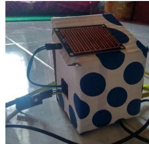
Gambar 8. Kancer Prototype 2