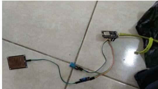
Gambar 7. Kancer Prototype 1

Kancer Prototype 2 sudah dikemas dalam satu kotak, dan cara kerjanya sama dengan prototype 1. Untuk hasil sensor data sudah disimpan dan dapat dilihat grafik perubahan suhu dan kelembaban.