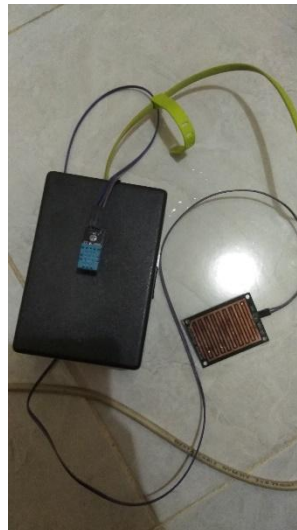
Gambar 9. Kancer versi 1.0

Kancer 1.0 dikemas dalam bentuk kotak yang terbuat dari mika, sehingga alat kancer tidak mudah rusak, dan bentuknya pun lebih rapi.