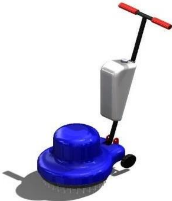
Gambar 2. Gambar Desain Alat

Hasil perancangan alat dapat dilihat pada Gambar 2.