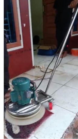
Gambar 3. Gambar Alat

Hasil penelitian ini adalah alat pembersih karpet yang dapat dilihat pada Gambar 3.