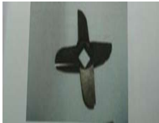
Gambar 3. Pisau Pemotong Daging

Gambar 3 merupakan pisau pemotong yang berfungsi sebagai alat pemotong daging yang berbahan stainless steel food grade type 304 yang mengandung 17% - 25% chrome, 8% - 20% nikel dan 0,08% karbon