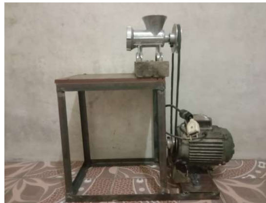
Gambar 7. Pembuatan Akhir Mesin Penggiling Daging Ayam

Mesin penggiling daging ayam yang dirancang dan dikonstruksikan dalam penelitian ini mempunyai beberapa bagian utama yang mendukung operasional kerjanya, yaitu motor penggerak, sistem rangka (frame), sistem transmisi, dan penggiling daging. Ukuran mesin yang dibuat mempunyai dimensi 54 x 27 x 40 cm, dan dibuat dengan sistem portable yang dilengkapi dengan roda penggerak karet sehingga bisa dipindah-pindahkan. Perancangan mesin yang dibuat dapat dilihat dalam Gambar 7.