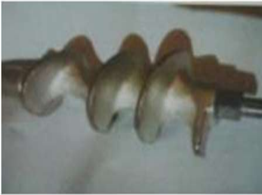
Gambar 4. Poros Penghalus Daging