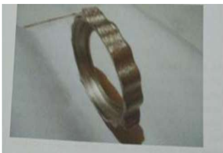
Gambar 6. Tutup Penggiling

Tutup penggiling ini berfungsi sebagai pengunci dan juga sebagai pengepress yang bertujuan untuk mengeluarkan daging yang ada pada penampang dan pisau penampang. Bentuk jelasnya seperti yang ditunjukkan pada Gambar 6.