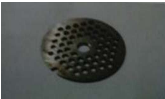
Gambar 5. Strainer / saringan

Strainer atau lubang saringan penggiling ini berfungsi sebagai tempat keluarnya daging yang sudah digiling [8], seperti yang ditunjukkan pada gambar 5.