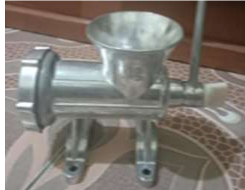
Gambar 2. Rumahan Penggiling Daging

Rumahan ini berfungsi sebagai tempat dimasukkannya daging yang akan digiling seperti yang ditunjukkan pada Gambar 2 [7].