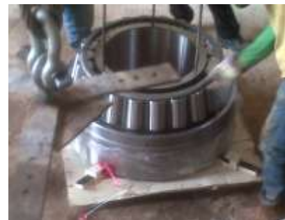
Gambar 14. Pemasangan Kaki Tiga