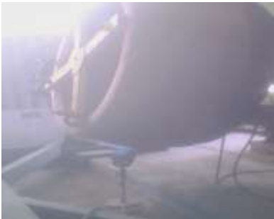
Gambar 10 Tyre Pada Saat Dipanaskan