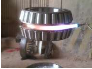
Gambar 15. Bearing Dipanaskan