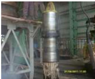
Gambar 5. Goresan pada shaft

Goresan yang terjadi pada dinding shaft disebabkan pada saat akan membuka bust, karna dilakukan dengan cara dipanaskan dan shaft juga memiliki 3 buah baut yang berguna untuk menahan kedudukan saat membuka grinding roller . Seperti yang terlihat pada Gambar 5.