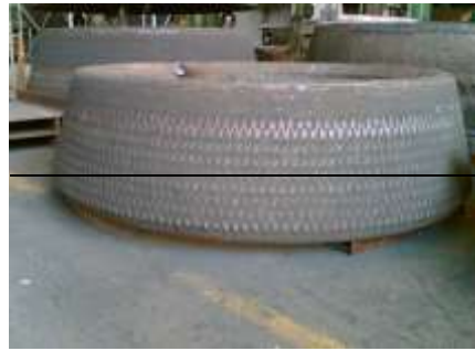
Gambar 12. Roller Tyre Yang telah selesai diperbaiki