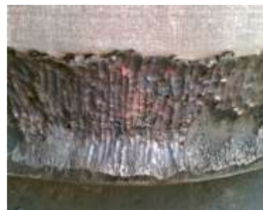
Gambar 8. Hasil Setelah di Gouging