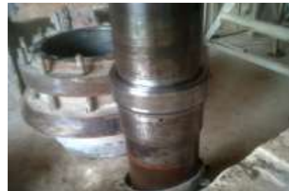
Gambar 13. Inner Ring Yang Terpasang