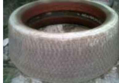
Gambar 3. Tyre