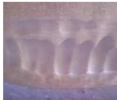
Gambar 6. Tyre Yang Rusak

Kerusakan pada tyre disebabkan oleh material yang tidak sama besar pada saat akan dilakukan penggilingan. Seperti yang terlihat pada Gambar 6.