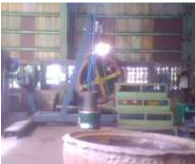
Gambar 11. Tyre Pada Saat Pengelasan