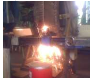
Gambar 7. Proses Gouging roller tyre