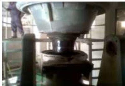
Gambar 17. seal yang bocor

Seal haus/meleleh disebabkan pada waktu panas yang berlebihan pada shaft . Untuk mengatasinya maka dilakukan penggantian seal. Seperti yang terlihat pada Gambar 17.