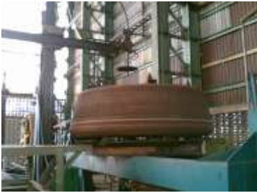
Gambar 9. Tyre Pada Table Mesin Welding Alloys