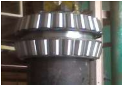
Gambar 16. Bearing Tertumpu Pada Inner Ring