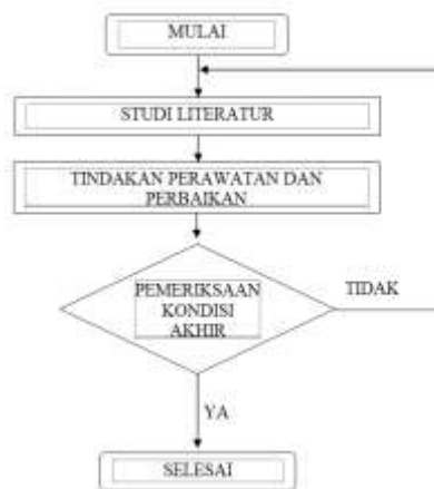
Gambar 1. Skema Perawatan dan perbaikan

Adapun langkah langkah dalam perawatan dan perbaikan mesin Vertikal mill yaitu : Mulai, Studi literatur, Tindakan perawatan dan perbaikan, Pemeriksaan kondisi akhir, sampai selesai, sehingga mesin dapat berfungsi dengan baik dan bekerja dengan optimal. Untuk lebih jelas diagram alir kerjanya dapat dilihat pada Gambar 1.