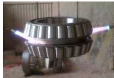
Gambar 4. Bearing

Berfungsi untuk memudahkan putaran tyre pada table . Bearing menjaga poros ( shaft ) agar selalu berputar terhadap sumbu porosnya dan menjaga suatu komponen yang bergerak linier agar selalu berada pada jalurnya. Untuk perawatan dari bearing tidaklah memerlukan perhatian khusus. Hal ini karena bearing tidak ada komponen yang rumit, jadi pada intinya adalah pemberian pelumas sesuai dengan kerja yang ada[10]. Seperti yang terlihat pada Gambar 4.