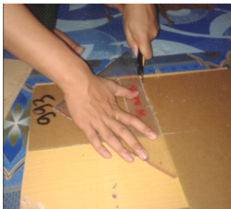
Gambar 2. Pemotongan Acrylic