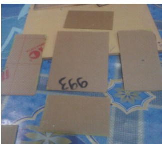
Gambar 3. Acrylic yang Telah Dipotong