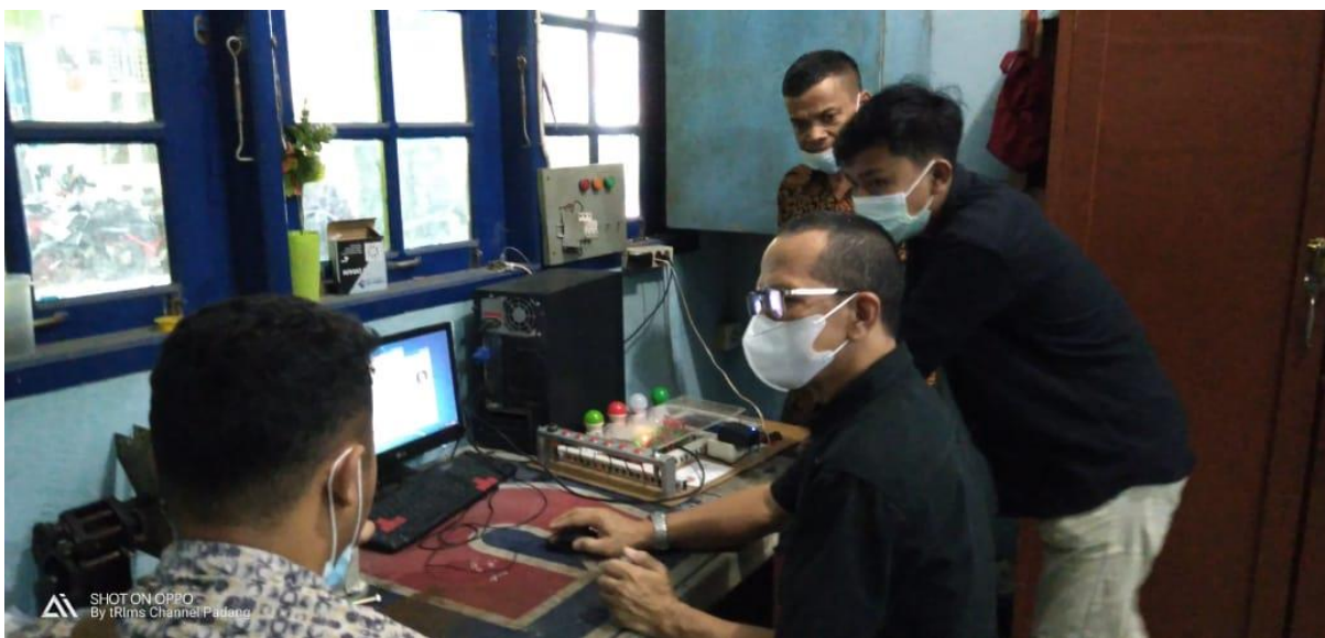
Gambar 6. Ketua tim membantu menghubungkan PLC dengan komputer

Mitra yang saat ini hanya memiliki satu unit PLC tidak dapat mengoptimalkan praktek karena rasio siswa dan alat praktikum tidak seimbang. Dengan adanya PLC berbasis papan Arduino ini, mitra sudah bisa berencana mengembangkan sendiri peralatan laboratorium karena membuatnya sangat mudah, biaya yang diperlukan tidak besar serta kompatibel dengan PLC standar industri dan hal ini dibuktikan pasca kegiatan PKM, mitra mengundang ketua tim untuk melakukan koneksi antara PLC berbasis papan Arduino dengan komputer yang ada di laboratorium mereka seperti terlihat pada Gambar 6.