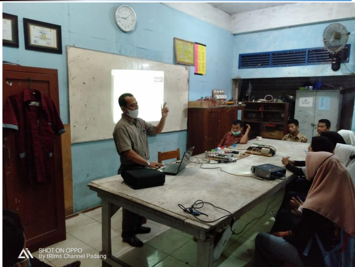
Gambar 5. Ketua tim menjelaskan penggunaan Outseal Studio

Mitra yang saat ini hanya memiliki satu unit PLC tidak dapat mengoptimalkan praktek karena rasio siswa dan alat praktikum tidak seimbang. Dengan adanya PLC berbasis papan Arduino ini, mitra sudah bisa berencana mengembangkan sendiri peralatan laboratorium karena membuatnya sangat mudah, biaya yang diperlukan tidak besar serta kompatibel dengan PLC standar industri dan hal ini dibuktikan pasca kegiatan PKM, mitra mengundang ketua tim untuk melakukan koneksi antara PLC berbasis papan Arduino dengan komputer yang ada di laboratorium mereka seperti terlihat pada Gambar 6.