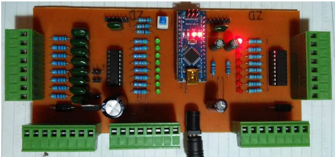
Gambar 3. Kit PLC berbasis papan Arduino

Gambar rangkaian papan shield I/O di ubah ke dalam bentuk jalur PCB lalu PCB yang telah selesai dibuat dengan meletakkan komponen elektronika di atasnya sehingga didapatkan hasil akhir PLC berbasis papan Arduino yang ditunjukkan Gambar 3.