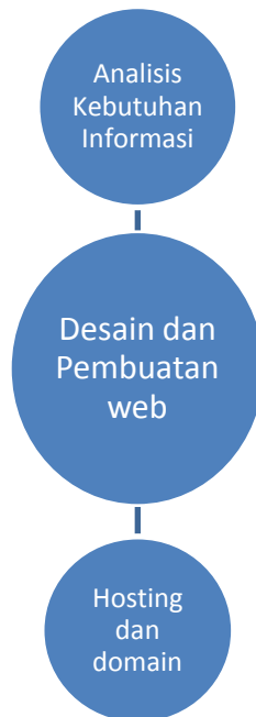
Gambar 1 Langkah-langkah pembuatan situs web profil

Pembuatan situs web profil menggunakan pemrograman Php dengan framework Codeigniter. Adapun langkah-langkah persiapannya dapat dilihat pada gambar 1.