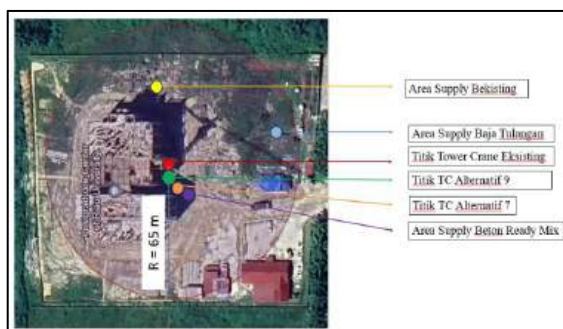
Gambar 4. Site lay out posisi Tc Eksisting, Tc Alternatif 7, Tc Alternatif 9, dan lokasi titik supply bekisting, baja tulangan, serta beton ready mix