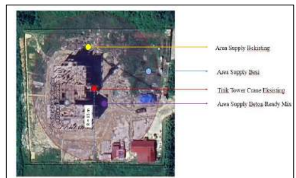
Gambar 2. Kondisi eksisting penempatan tower crane radius 65 m

Skenario penempatan alternatif dipilih merujuk pada panjang jib ( 65 m ) dan feasible area (area kerja yang layak). Kondisi eksisting tower crane dengan radius tower crane 65 m dapat dilihat pada Gambar 2. berikut.